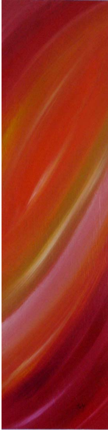
« Prémices » Acrylique sur Bois 110 x 30