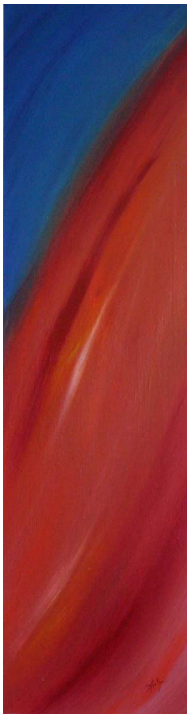
« Ellipse » Acrylique sur bois 110 x 30