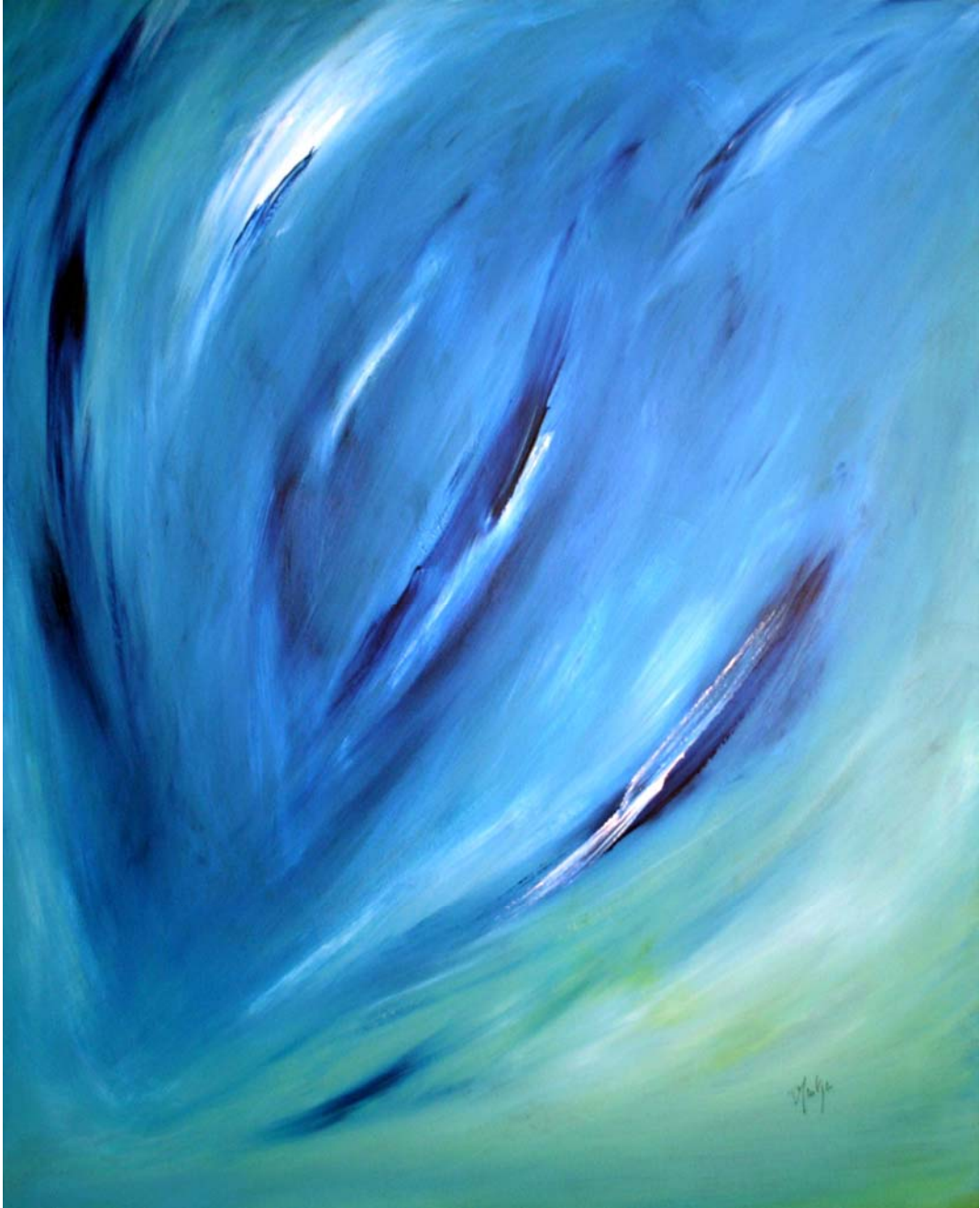
« Présage » Acrylique sur toile 81 x 100