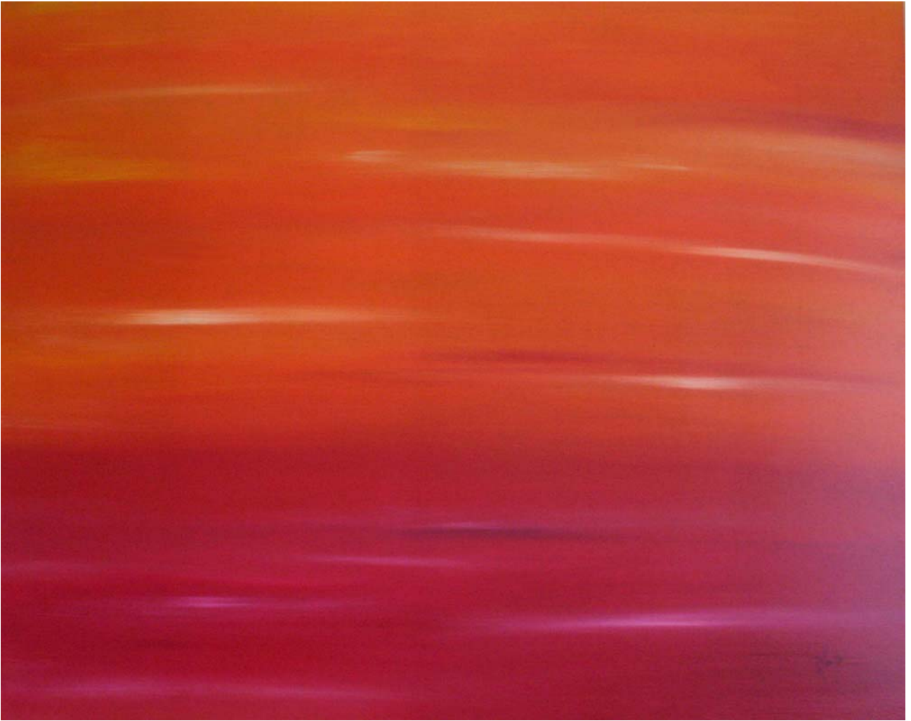
« L'île » Acrylique sur toile 81 x 100 #A0071 2008