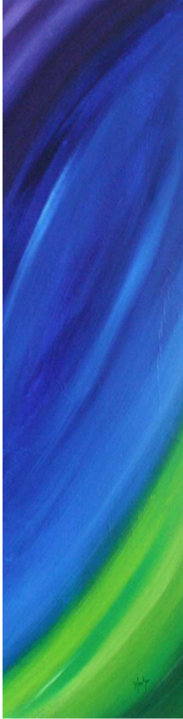
« Le Val » Acrylique sur bois 110 x 30