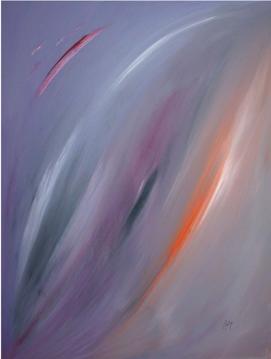
« Evasion » Acrylique sur toile 116 x 89